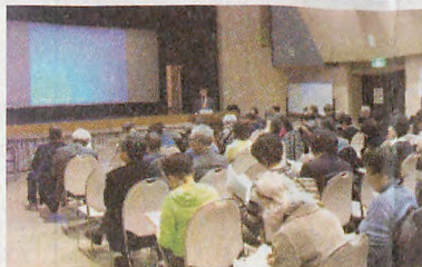
会場には多くの聴衆が訪れた

一般社団法人シニア社会学会は3月22日(木)、ICTによる高齢者孤立防止モデル普及事業報告会を開催した(なぎさ音楽苑共催)。2月から4回連続で開催しているシニアライフを考える講座の最終回で、ICT(情報